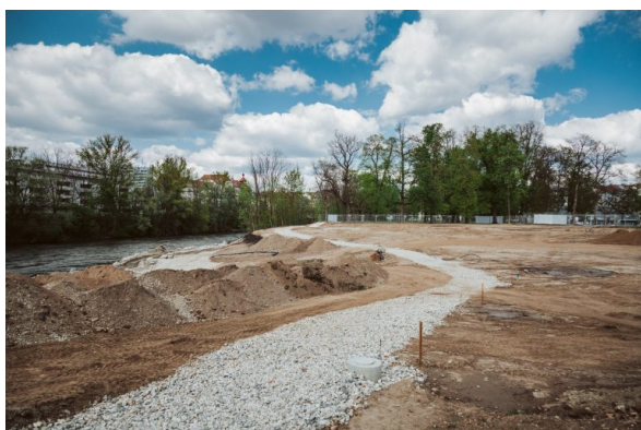
April 2019

In den darauffolgenden Wochen wurden die Gehwege geschottert und die Bucht nahm langsam Form an. Der Kanal verschwand gleichzeitig im Untergrund und war nicht mehr zu sehen.