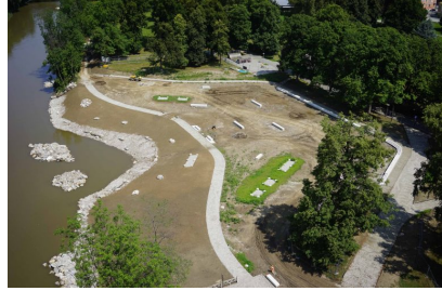
Juli 2019