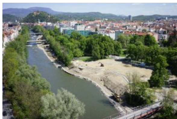
März 2019