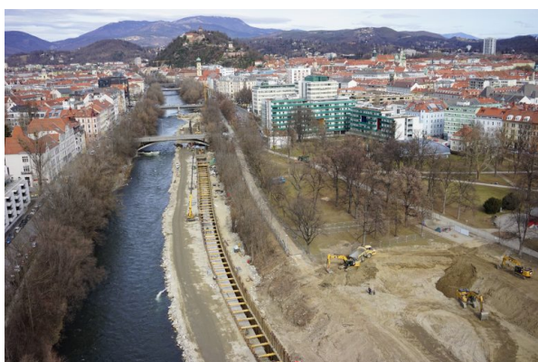
Februar 2019 | Foto: Wüster

Im Februar 2019 starteten die Bauarbeiten mit der Augartenabsenkung. Damit wurde gleichzeitig die direkte Anbindung ans Murufer geschaffen.