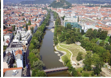
August 2019

Die im gesamten Augartenpark zum Einsatz kommenden, neuen LED-Lampen wurden im Herbst auch in der Bucht aufgestellt. Die neue Beleuchtung sorgt abends für mehr Sicherheitsgefühl. Im November fanden die letzten Pflanzungs- und Aufforstungsarbeiten statt und die Bucht ging in die Winterpause, damit bis zum Frühjahr alles gut anwachsen konnte.