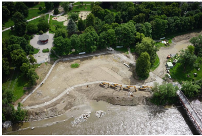
Juni 2019

Vom bestehenden Uferbereich wurden zwei Inseln stehen gelassen und abgesenkt - dies dient zur Strukturierung der Wasseroberfläche. Außerdem erfolgte im Juli die Schotterung des Uferbereiches sowie die Errichtung der Sitzgelegenheiten in der Bucht. Deutlich grüner wurde es dann im August und die Murarena nahm langsam ihre geplante Form an.