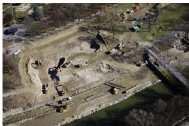
März 2019

In den darauffolgenden Wochen wurden die Gehwege geschottert und die Bucht nahm langsam Form an. Der Kanal verschwand gleichzeitig im Untergrund und war nicht mehr zu sehen.